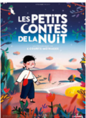
Les Petits contes de la nuit 6 courts métrages